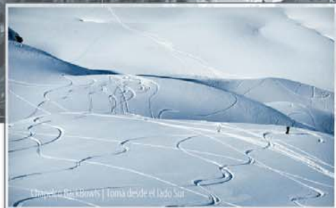
Chapelco BackBows | Toma desde el lado Sur