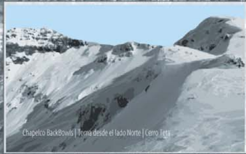
Chapelco BackBows | Toma desde el lado Norte | Cerro Teta